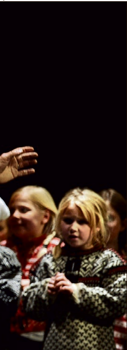
...e for å bli avlyst.